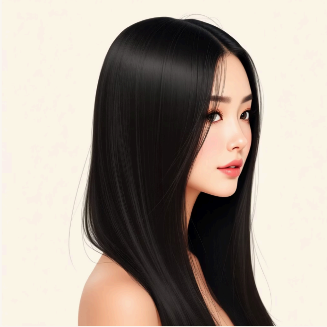
Cabello recién alisado

Brillo intenso, movimiento natural y textura suave al tacto