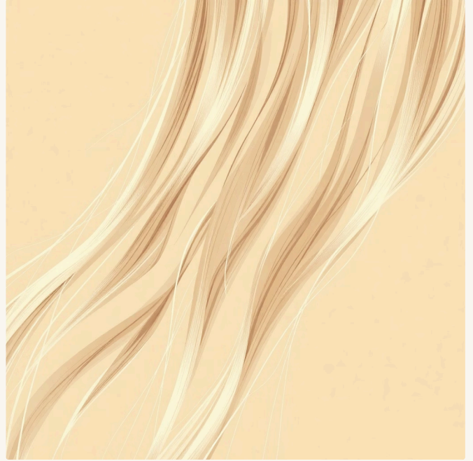
Cabello semanas después

Textura áspera, quiebres visibles y pérdida de vitalidad